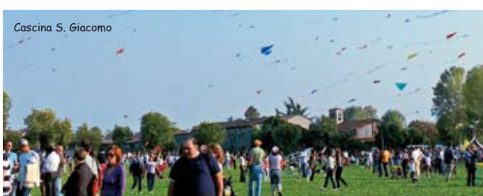
Cascina S. Giacomo